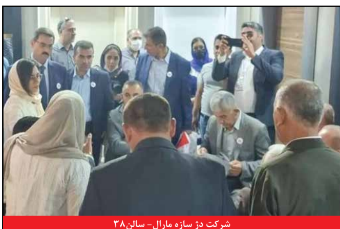
شرکت دژ سازه مارال - سالن ۳۸