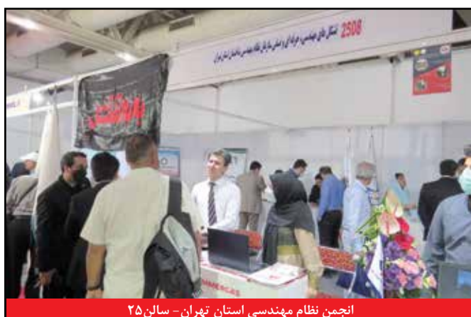
انجمن نظام مهندسی استان تهران - سالن ۲۵