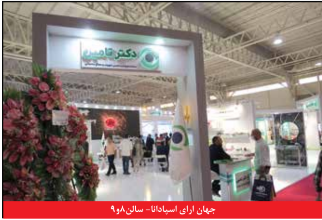
جهان آرای اسپادانا - سالن ۹۰۸