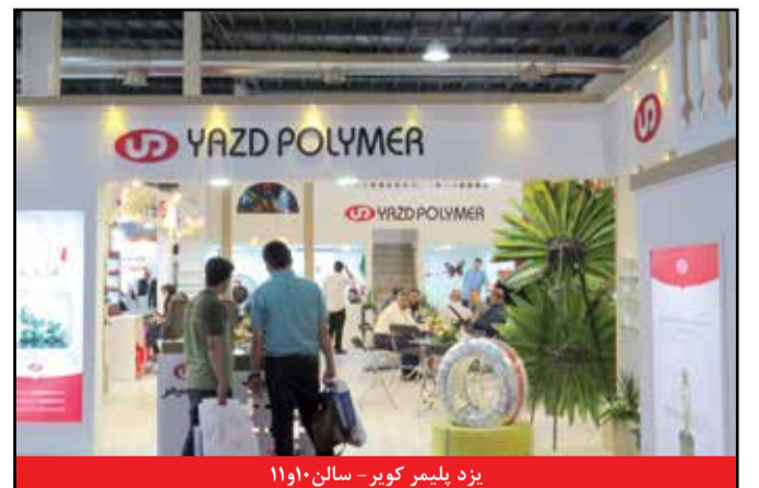
یزد پلیمر کویر - سالن ۱۱۰