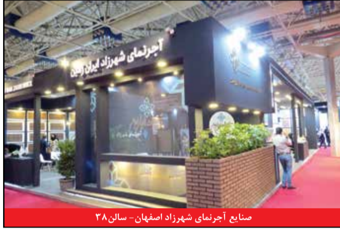
صنایع آجرنمای شهرزاد اصفهان - سالن ۳۸