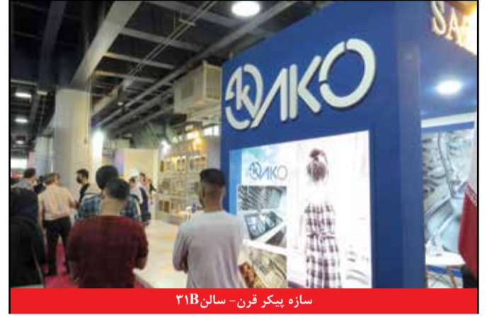
سازه پیکر قرن - سالن ۳۱۸