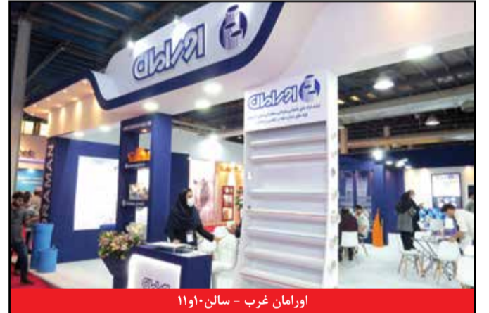
اورامان غرب - سالن ۱۱۰