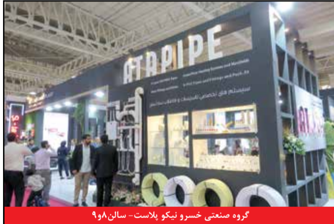
گروه صنعتی خسرو نیکو پلاست - سالن ۹۰۸