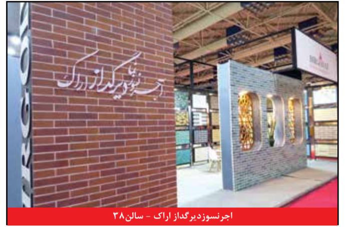
آجرنوسوزدیگاز اراک - سالن ۳۸