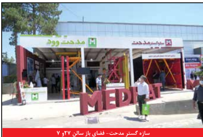
سازه گستر مدحت - فضای باز سالن ۷ و ۲۷