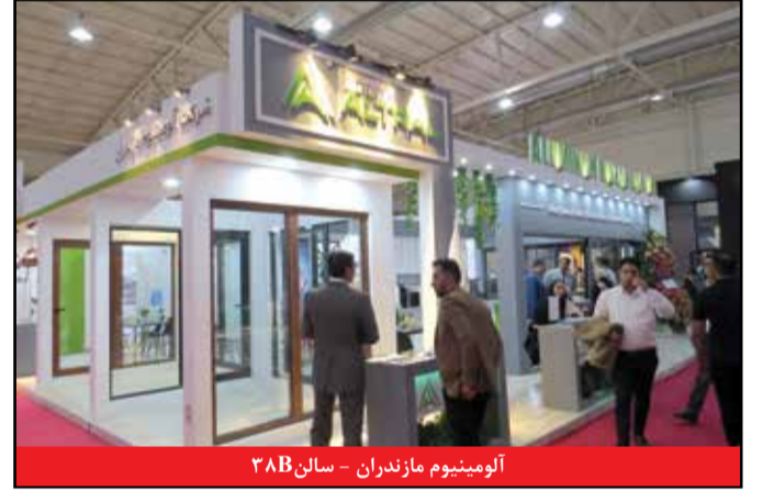
آلومینیوم مازندران - سالن ۳۸