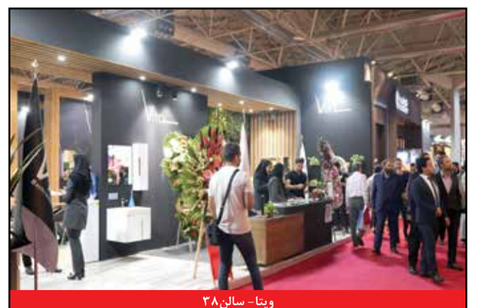
ویتا - سالن ۳۸