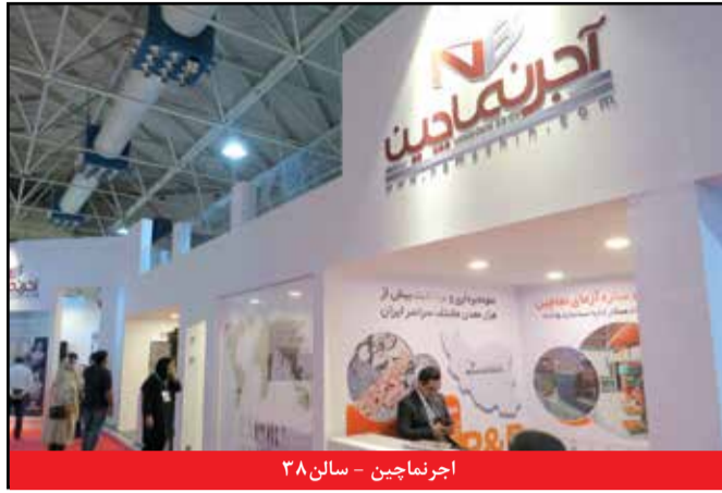
آجرنامچین - سالن ۳۸