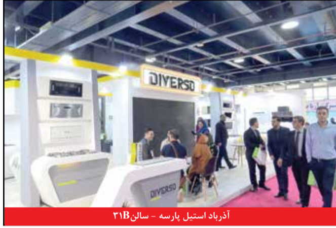
آذرباد استیل پارسه - سالن ۳۱۸