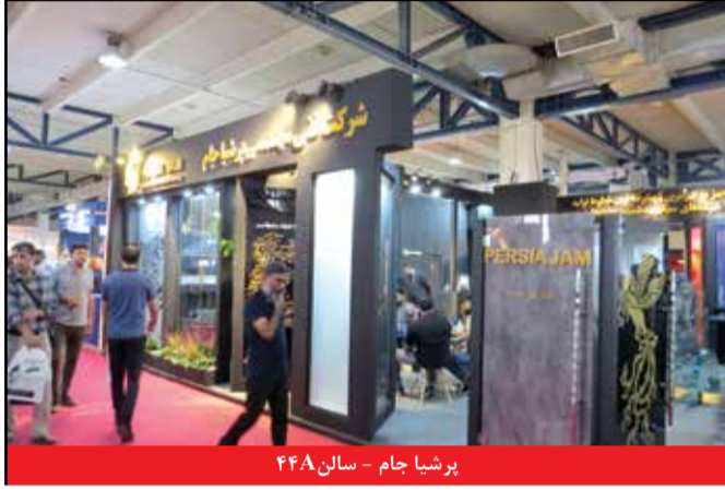
پرشیا جام - سالن ۴۴۸