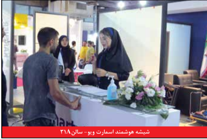
شیشه هوشمند اسمارت ویو - سالن ۳۱۸