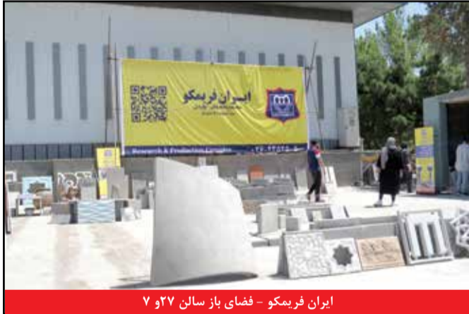
ایران فریمکو - فضای باز سالن ۷ و ۲۷